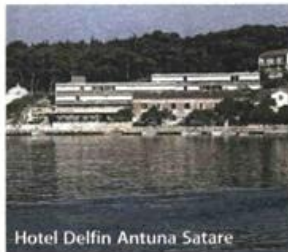
Hotel Delfin Antuna Satara