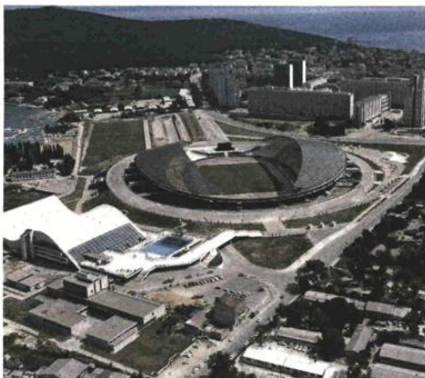
Poljudski stadion Boris Magaša u Splitu

Izložba predstavlja brojne arhitektonske projekte, u rasponu od turističkih eksperimenata na jadranskoj obali, koncepta za nove gradove i izložbene paviljone na međunarodnim izložbama do zloglasnih javnih građevina i povijesnih spomenika u bivšoj Jugoslaviji od 1948. do 1980. godine