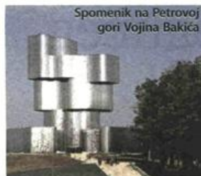
Spomenik na Petrovoj gori Vojina Bakica